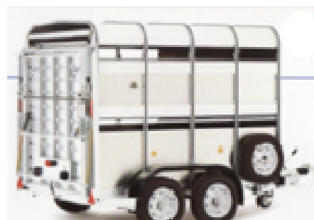
Bétaillères Ifor Williams

Nouveau pour les éleveurs ovins et caprins: VETRACAP: produit de trempage post traite pour limiter l'apparition de mammite est aujourd'hui disponible dans vos coopératives.